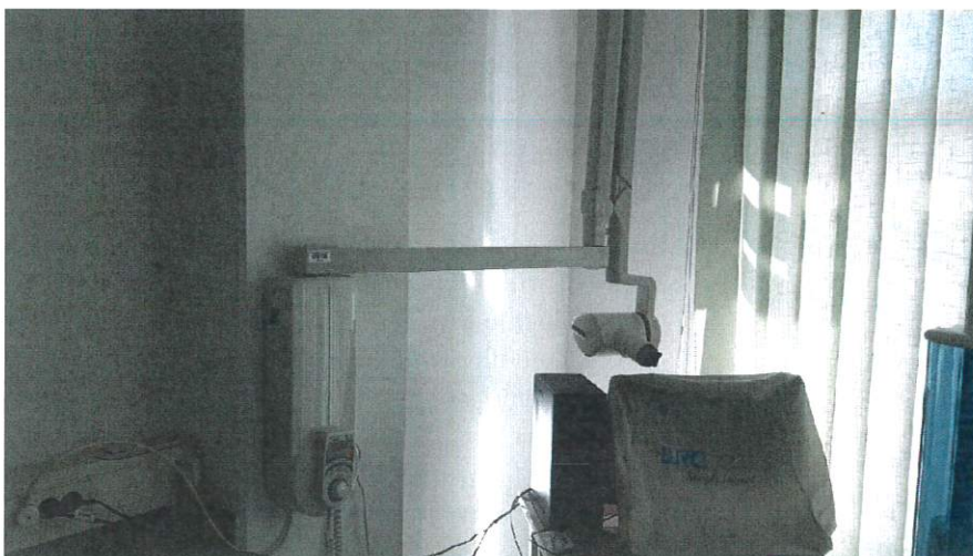
Slika 1: Rentgenski aparat CARESTREAM CS 2200