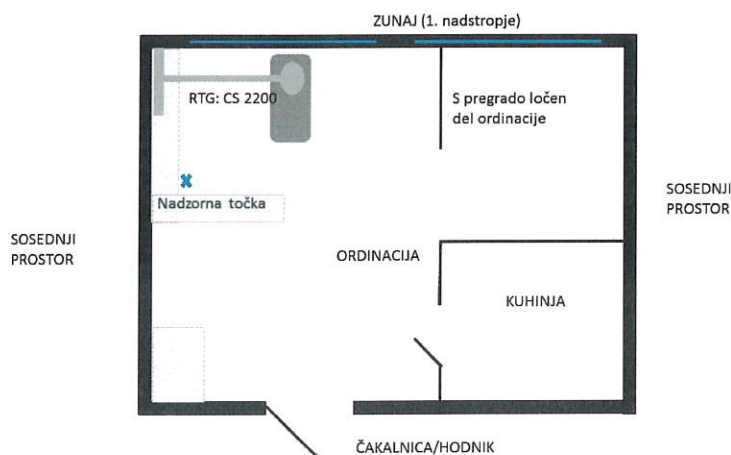
Slika 2: Shematski tloris namestitve RTG aparata v zobni ambulanti.